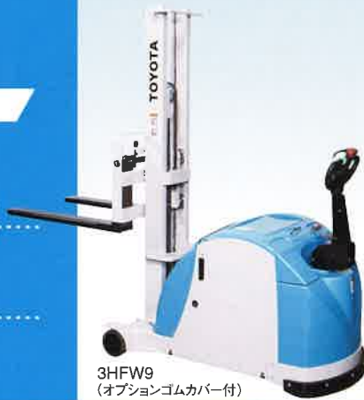
3HFW9 (オプションゴムカバー付)