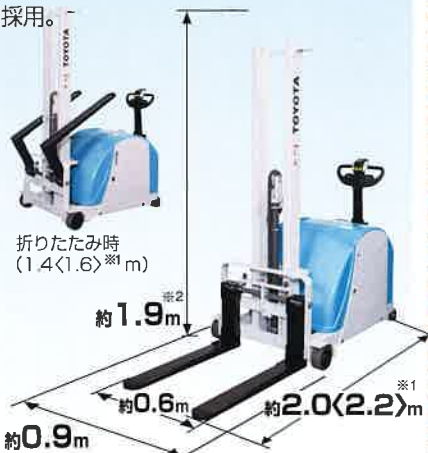
折りたたみ時 (1.4<1.6> ※1 m)

全高約1.9m、全長2.0<2.2> ※1 mのコンパクトボディ。最小旋回半径約1.1<1.2> ※1 m。エレベータの乗り入れも容易な反転式フォーク(折りたたみ時全長約1.4<1.6> ※1 m)を採用。