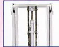
ダブルマスト (オプション) 最大揚高300cm