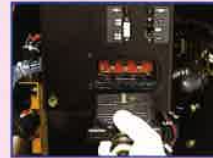
車載チャージャー 充電はプラグを差し込み スイッチを入れるだけ。