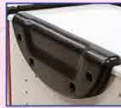
ウエストサポートパット