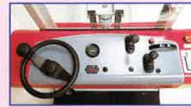
パワーステアリング (FBT5はオプション)