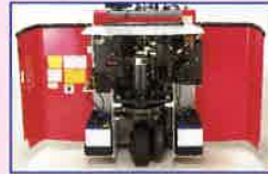
メンテナンスを容易にする フルオープンサイドドア。 (写真はFBT5)