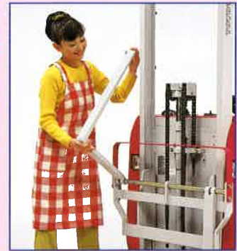
フォークを反転収納