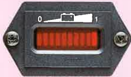
バッテリー容量計 見やすい表示で充電タイミングを 一目でチェック。